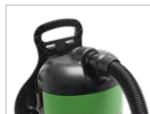
POIGNÉE ET FLEXIBLE ERGONOMIQUES