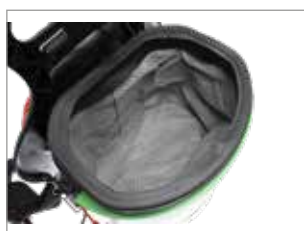
FILTRE EN TISSU RÉSISTANT