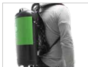
FACILE À TRANSPORTER