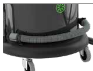
TUYAU DE VIDANGE