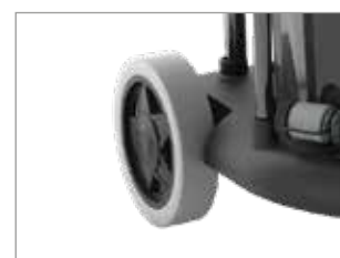
GRANDES ROUES ARRIÈRE ANTI-TRACE