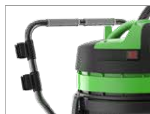
CHARIOT AVEC POIGNÉE